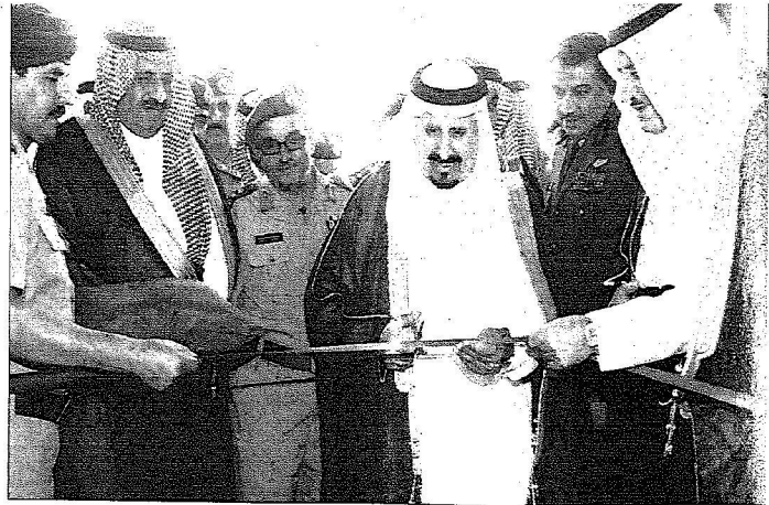
الأبو سلطان يشن أعمال التحديث في مكتب سموه

استقبل شيخ قبيلة الغفران من آل مرة والسجناء السعوديين المفرج عنهم في قطر