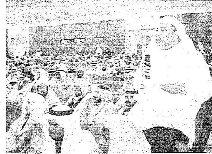
أسئلة من الحضور للدكتور الربيعية