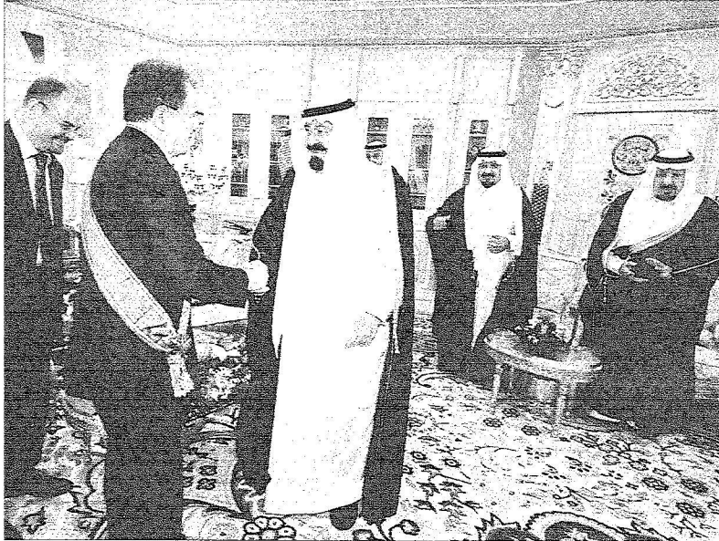
خادم الحرمين الشريفين في لقاء سابق مع رئيس الوزراء الإيطالي

أعدت الحكومة الإيطالية برنامجاً حافلاً للملك عبدالله خلال زيارته لروما التي تستغرق ثلاثة أيام حيث من المقرر ان يلتقي مساء اليوم مع الرئيس الإيطالي جورجيو نابوليتانو في قصر الكوزوبرتاليه ، وسيعقب اللقاء جلسة مباحثات رسمية من المقرر ان يتم خلالها استعراض كافة ملفات العلاقات الثنائية وسبل تنمية أواصر هذه العلاقات في جميع الميادين السياسية والاقتصادية والتجارية بالإضافة إلى مناقشة المستجدات التي تشهدها في منطقة الشرق الأوسط. وسيشارك في المباحثات أعضاء الوفد السعودي الرسمي المرافق وسيعقب المباحثات تبادل الأوسمة كما يقدم الرئيس الإيطالي أيضاً مساء اليوم حفل عشاء تكريماً لخادم الحرمين الشريفين وسيتم خلال الحفل تبادل الكلمات حيث سيلقي الرئيس الإيطالي كلمة ترحيبية يعقبها كلمة للملك عبدالله بن عبدالعزيز. وسيحضر الحفل الوفد الرسمي المرافق إلى جانب