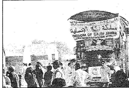
تبرعات إنسانية تصل إلى المناطق المتضررة

وشهدت مستودعات الحملة كميات كبيرة من التبرعات استوجب على القائمين عليها تسيير القافلة الإغاثية بعد عملية فرز المواد العينية في المستودعات