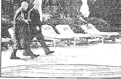
بوش في تزمة مع كرزاي في شرم الشيخ