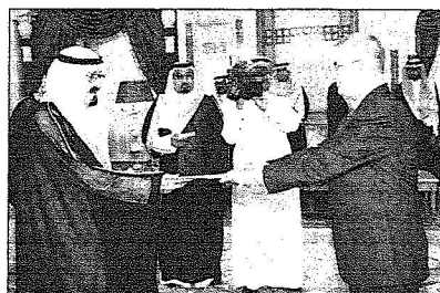
خادم الحرمين يتسلم أوراق السفير الفنلندي