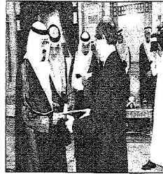
خادم الحرمين استقبالاً لسفير اليابان