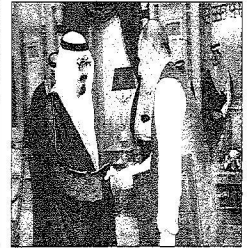
لكم عبدالله بن فيصل آل سعود أمير القطيف