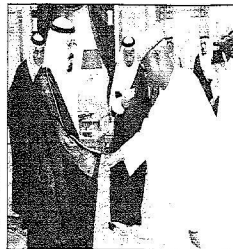
لكم عبدالله بن فيصل آل سعود أمير القطيف