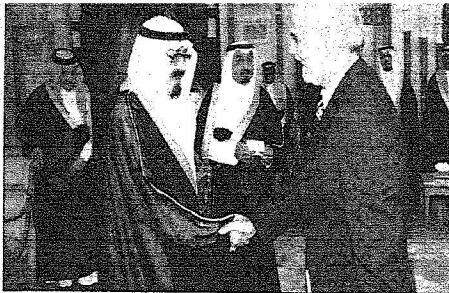
خادم الحرمين يتسلم أوراق اعتماد السفير العراقي