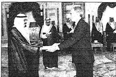
الملك عبدالله يتسلم أوراق اعتماد سفراء كندا