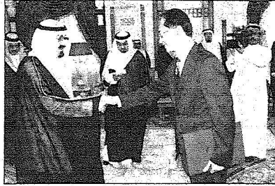
الملك عبدالله خلال تسلمه أوراق اعتماد سفير ستغافورة

بعد تلك التَقَطت الصور التذكارية بهذه المناسبة.