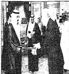
لكم عبدالله بن فيصل آل سعود أمير القطيف