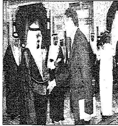
خادم الحرمين خلال استقباله سفير فنلندا