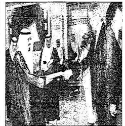
خادم الحرمين استقبالاً لسفير لوزين