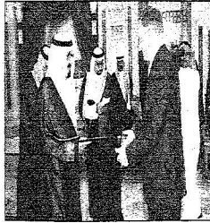
لكم عبدالله بن فيصل آل سعود أمير القطيف

الخارجية وصاحب السمو الملكي الأمير مقرن بن عبدالعزيز رئيس الاستخبارات العامة وصاحب السمو الملكي الأمير عبدالعزيز بن عبدالله بن عبدالعزيز مستشار خادم الحرمين الشريفين وصاحب السمو الملكي الأمير منصور بن ناصر بن عبدالعزيز مستشار خادم الحرمين الشريفين وصاحب السمو الأمير الدكتور بندر بن سلمان بن محمد آل سعود مستشار خادم الحرمين الشريفين وصاحب السمو الملكي الأمير عبدالعزيز بن فهد بن عبدالعزيز وزير الدولة عضو مجلس الوزراء ومعالى رئاسة مجلس الوزراء وزير التجارة والصناعة الأستاذ عبدالله بن أحمد زیتل وسفير خادم الحرمين الشريفين لدى جمهورية الهند فيصل بن حسن طراد وسفير الهند لدى المملكة أم أو اتش فاروق. من جانب آخر استقبل خادم الحرمين في مكتبه بالديوان الملكي في قصر اليمامة أسس معالي رئيس جهاز الاستخبارات الباكستاني الفريق أحمد شجاع باشا. ونقل معاليه لخادم الحرمين الشريفين خلال الاستقبال تحيات