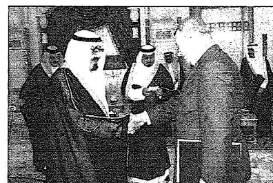
الملك عبدالله تسلمه أوراق اعتماد سفير أوكرانيا