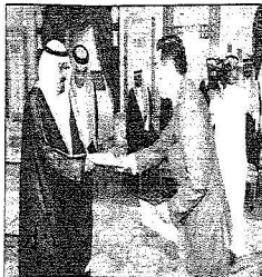
خادم الحرمين استقبالاً لسفير سنغافورة