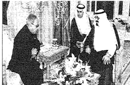
الملك عبدالله يستقبل وزير المالية الهندي