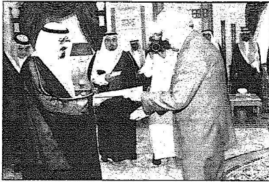
خادم الحرمين مستقبلاً سير أيرلندا

وتقديره لأصحاب الجلالة والفخامة قادة دولهم. حضر تقديم أوراق الاعتماد صاحب السمو الملكي الأمير سعود الفصل وزير الخارجية وصاحب السمو الملكي الأمير مقرن بن عبد العزيز رئيس الاستخبارات العامة وصاحب السمو الملكي الأمير عبدالعزيز بن عبدالله بن عبد العزيز مستشار خادم الحرمين الشريفين وصاحب السمو الملكي الأمير منصور بن ناصر بن عبد العزيز مستشار خادم الحرمين الشريفين وصاحب السمو الأمير الدكتور بندر بن سلمان بن محمد آل سعود مستشار خادم الحرمين الشريفين وصاحب السمو الملكي الأمير عبدالعزيز بن فهد بن عبد العزيز وصاحب السمو الأمير مجلس الوزراء ورئيس ديوان رئاسة مجلس الوزراء ومعالى رئيس الديوان الملكي الأستاذ خالد بن عبدالعزيز التويجري ومعالى رئيس المراسم الملكية الأستاذ محمد