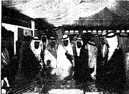
الملك عبدالله يستمع إلى شرح عن أحد المشاريع