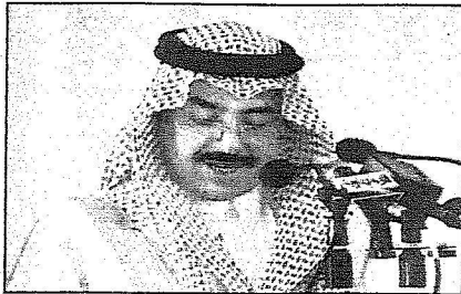
وزير النقل يلقي كلمته

بعد ذلك تسلم حفظة الله هدية تذكارية بهذه المناسبة من معالي مدير الجامعة.