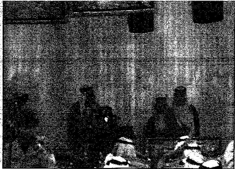
د. التصيين يلقى كلمته في المحفل

المصدر : الرياض التاريخ : 24-07-2006 العدد : 13909 الصفحات : 2 المسلسل : 8