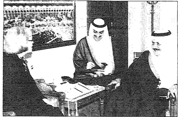
الأمير نايف يلتقي المفوض العام لوكالة الانروا