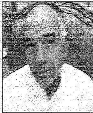
محمد بن الزاي