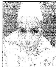
الدكتور خالد بن الفواز السيد