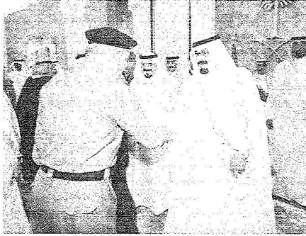
خادم الحرمين يرحب بأحد منسوبي الأمن

وأفاد مدير الأمن العام رئيس اللجنة الأمنية للحج أن التعامل مع ما يزيد على ثلاثة ملايين حاج وبتزايد ملحوظ كل عام يتطلب جهوداً نوعية وخططاً دقيقة تضمن بمشيئة الله تكامل العمل وتحقيق الأهداف لخدمة ضيوف الرحمن بدءاً من الاستقبال عبر منافذ المملكة البرية والبحرية والجوية وتسهيل إجراءات الدخول وتنظيم ومتابعة الرحلات إلى الأماكن المقدسة والتنقلات بين المشاعر وفق خطط دقيقة تستوعب المتطلبات وتلبي الحاجات وتتغلب على الصعوبات. وأوضح أن هذا العام شهد بحمد الله نجاح خطة التصعيد إلى عرفة حيث تم ذلك في زمن قياسي هياً للحجاج الوقوف بمشعر عرفة في العاشرة من صباح اليوم التاسع ولأول مرة كما كانت خطة نفرة الحجاج إلى مزلفة موقفة وناجحة مشيراً إلى أنه استكمال ضيوف الرحمن لمناسك حجهم يتم وفق ما خطط له مع تسخير كافة الإمكانيات المادية والبشرية والتنظيمية إضافة إلى الاستعداد الكامل لمواجهة كل الاحتمالات التي تحدث نتيجة تحرك هذه الجموع الغفيرة في زمن ومكان محدود.