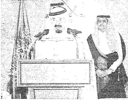
الملك يلتقي كلمته