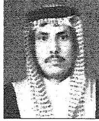
الملك عبدالله بن عبدالعزيز

الشريفين والمحافظه على بيوت الله الذي نتشرف باستقباله خلال هذه الأيام فقد لبس الشمال أزي حلقا وأبني زينتها وقدم أغلى ما لديه فرحاً بقدومه الميمون الذي طابما عطفنا لاستقباله طمئنا للقائه بمنطقة الحدود الشمالية تفخر بهذه الزيارة وتفرح ربوعنا بملك الإنسانية خادم الحرمين الشريفين الملك عبدالله بن عبدالعزيز آل سعود الذي نذر نفسه لخدمة الدين ثم الوطن وحصل حكومته مسؤولية خدمة المواطن ونحن والحمد لله كنا وما زلنا نتشرف بخدمة بيوت الله والقيام عليها وقد أدت المملكة العربية السعودية منذ نشأتها على هذه الخدمة من توسعة الحرمين الشريفين وبناء للمساجد داخليا وخارجيا وإنشاء وزارة مستقلة للشؤون الإسلامية والأوقاف الدعوية والإرشاد واحتضان المسابقات التولية والمحلية لحفظ القرآن الكريم والسنة النبوية الرشيدة منذ عهد المؤسس الملك عبدالعزيز رحمه الله إلى الاهتمام بالقرآن والسنة النبوية من إنشاء دار للتوحيد بالطائف سنة 1364هـ وإنشاء كلية الشريعة عام 1369هـ بمكة المكرمة إلى مدارس التحفيظ وحلق الذكر في كل مكان وقد سار على هذا الطريق أبناء الملك المؤسس ومشوا على هذا النهج بكل إخلاص وتقان وحب وعطاء طالبين رضاء الله سبحانه وتعالى ومتخذين أوعاوان يعينونهم على الخير والصلاح والذين لا يألون جهداً في نشر الدين في أصقاع الأرض وحفظ كتاب الله العزيز والعناية بالمساجد أينما وجدت وهذا واضح حيث إن أساس الحكم في المملكة العربية السعودية قام على كتاب الله وسنة رسول الله صلى الله عليه وسلم كما نص على ذلك النظام الأساسي للحكم والذي تنفرد عنه باقي الأنظمة والوائح التي تخدم الدين في المقام الأول منها هي الأعمال الدؤوية لنشر علوم كتاب الله وسنة رسوله الأمين وتبني تحقيق كتاب الله