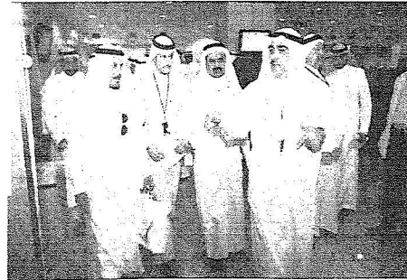
تفهي مع مسؤولي المدينة في أحد أقسام الأمانة

وجده تحتاج الى دعم إضافي يبلغ ٧ مليارات ريال لتحقيق الجوانب الهامة للخطة الاستراتيجية التي ليس لها عامل استثماري وخادم الحرمين الشريفين وعدنا وبعد جده خيرا وأنا وائق من ماطلبناه سيحقق ان شاء الله في القريب الاعتمادات المالية