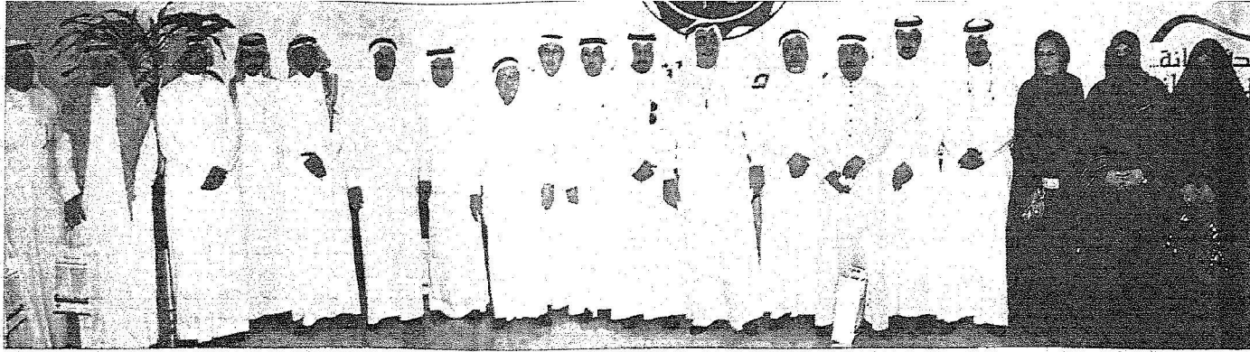
صورة جماعة لمتطوعي المدينة وأمانة جدة