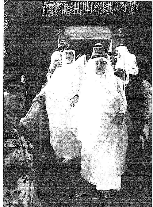
الأمير خالد الفيصل عقب تشرفه بفعل الكعبة