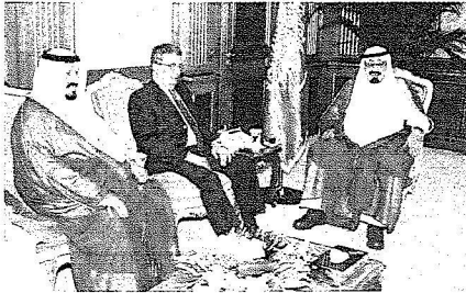
خادم الحرمين لدى اجتماعه بأمين جامعة الدول العربية