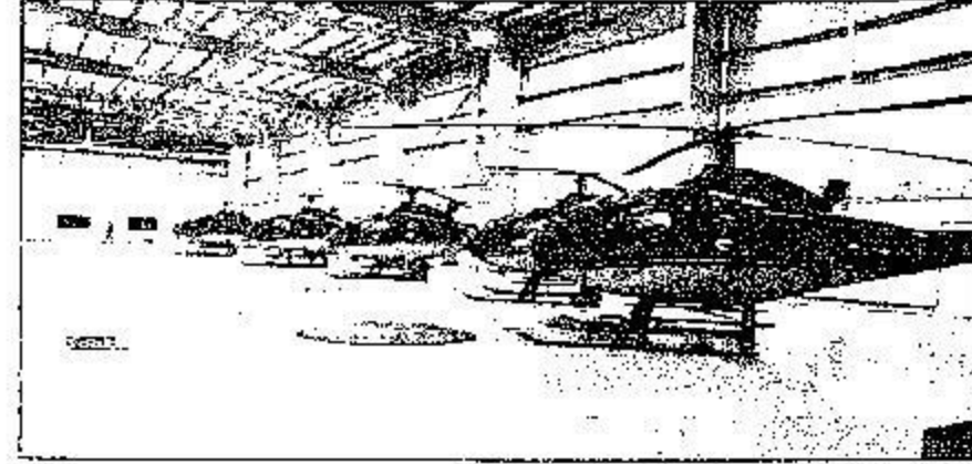
تجهيزات الدفاع المدني

لهذا العام من معالي الفريق سعيد التويجري الذي يقف على هرم هذا القطاع والجهاز الأمني الحساس كاشفاً في ثنايا حوارنا معه عن استعدادات مذهلة وخطط تطويرية تنم عن حراك عملي لاقت لجهاز أمني اعتاد مواجهة المخاطر بفكر ثاقب ورؤية استباقية وهمة طموحة تفصح عن الاستنفار غير العادي لكافة قطاعات الدولة التي تتشاطر شرف خدمة هذه الشعيرة العظيمة فإلى مضامين هذا الحوار: