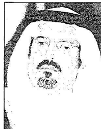
الأمير سعود بن عبدالعزيز