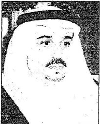
الأمير فهد بن بندر