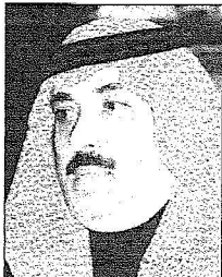
الأمير متعب بن عبدالله