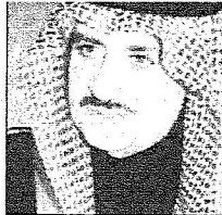
الأمير فهد بن سلطان