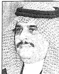
الأمير سلطان بن فهد