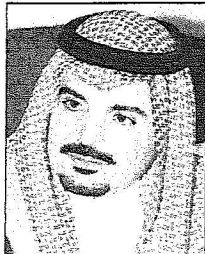
الأمير عبدالعزيز بن ماجد