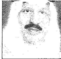
الأمير محمد بن ناصر