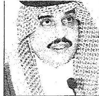
الأمير محمد بن فهد