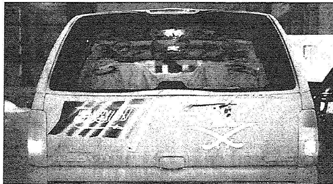
جانبة من مظفر الاحتفال باليوم الوطني