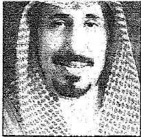
الأمير مشعل بن سعود