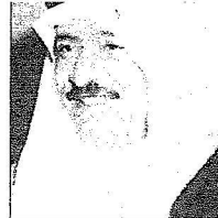
الأمير محمد بن سعود