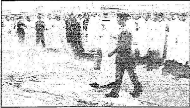
تدريب عملي لكيفية استخدام المشاية من أحد المشيرين

والمداخل ومخارج الطوارئ داخل المخيمات منعاً للزحام وحوادث الدخس البشري وتيسيراً لأداء المناسك بكل يسر وسهولة.