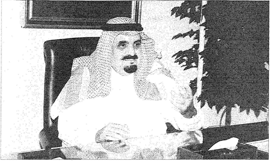
إجماع لا مثيل له بين الأسرة على نظام هيئة البيعة