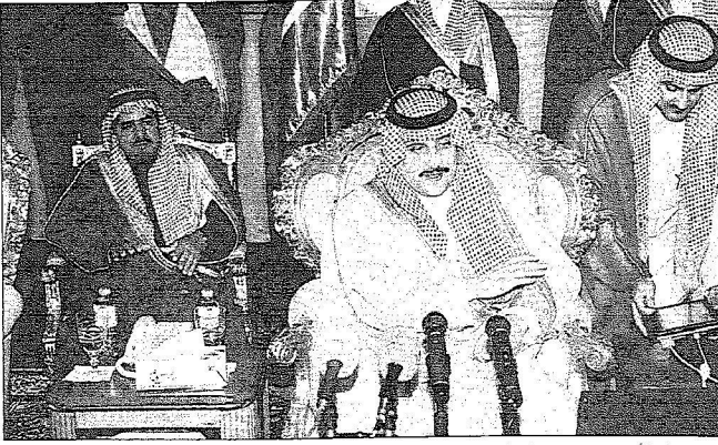
إحدى زيارات الأمير محمد بن فهد لمحافظة بقيق