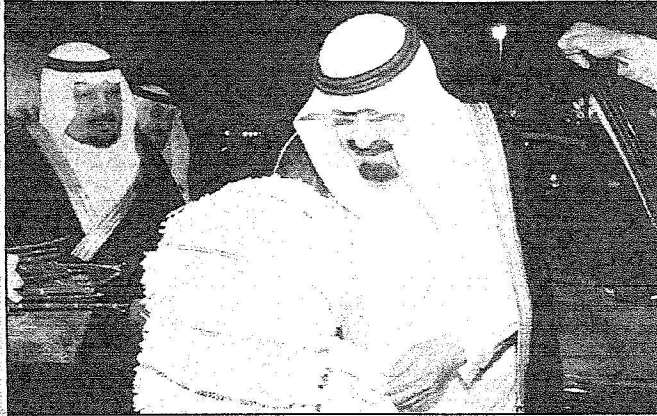
المليك يحيي طفولة جازان