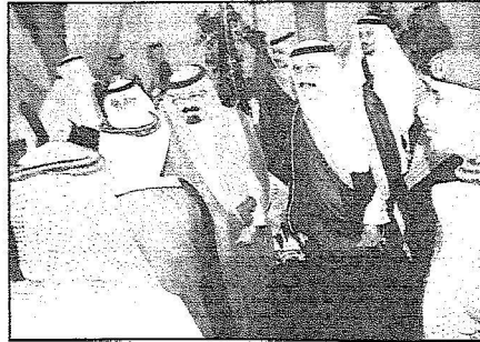
خادم الحرمين الشريفين لدى وصوله إلى جازان مساء أمس