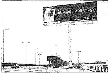
لوحة ترحيبية بالملك