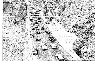
طريق عقبة الهدا