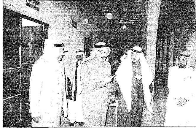
الأمير محمد بن ناصر أثناء زيارته