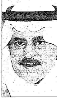
الأمير نايف بن عبدالعزيز

ومن جهته إجاب صاحب السمو الملكي الأمير سلطان بن عبدالعزيز آل سعود ولي العهد نائب رئيس مجلس الوزراء وزير الدفاع والمفتش العام بالشكر والتقدير على المشاعر والجهود الطبية التي بذلت لخدمة حجاج بيت الله الحرام متمنياً للجميع دوام التوفيق . ذلك إثر تلقي سموه الكريم