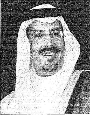
الأمير سعود بن عبدالحسن