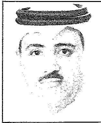
د. علي الصبح

قال وزير البنية التحتية الدكتور خالد الفهد في اللقاء الحكومي لإدارة مشاريع التعاملات الإلكترونية الحكومية من أبرز العناوين