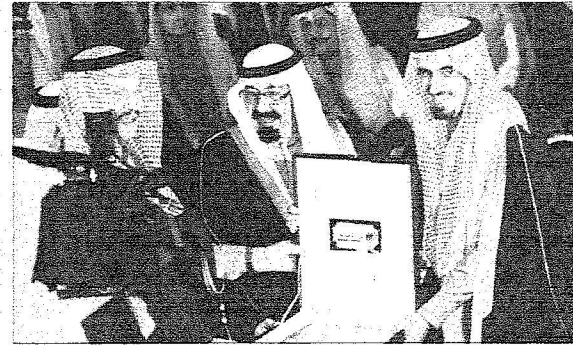
المليك خلال رعايته حفل تدشين مشروعات جامعة الملك سعود