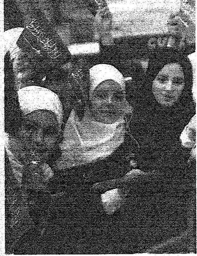
طالبات وطلاب سعوديون في استقبال خادم الحرمين الشريفين أمام السفارة السعودية أمس

خادم الحرمين الشريفين اننا نؤمن بان كل منتهجت سعودي يجب ان يكون سفيرا لوطنه وانه وسلة اعلامية متقلبة».