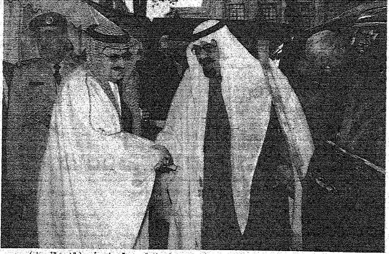
الملك عبد الله يسلم على الأمير محمد بن نواف لدى وصوله إلى مقر السفارة السعودية في لندن أمس

حيث تسعى بدعم مباشر من المقام السامي الكريم إلى الدفاع عن الوطن وعن المبادئ الإسلامية الرفيعة التي قامت عليها البلاد فضلاً عن إبراز الحقائق التي غالباً ما يتم إخفاؤها أو تشويهها.