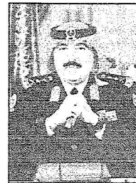
الفريق أول ركن متعب بن عبدالله

يرعى خادم الحرمين الشريفين الملك عبدالله بن عبدالعزيز آل سعود بعد غد (الأربعاء) حفل افتتاح المهرجان الوطني الرابع والعشرين للتراث والثقافة الذي ينظمه الحرس الوطني سنوياً في الجنادرية حيث يبدأ الاحتفال بسباق الهجن السنوي الكبير. وأكد صاحب السمو الملكي الفريق أول ركن متعب بن عبدالله بن عبدالعزيز نائب رئيس الحرس الوطني المساعد للشؤون العسكرية ونائب رئيس اللجنة العليا للمهرجان أن مسيرة المهرجان الوطني تمضي بتوفيق الله أولاً ثم بالرعاية والدعم الذي يحظى به المهرجان من لدن خادم الحرمين الشريفين الملك عبدالله بن عبدالعزيز وصاحب السمو الملكي الأمير سلطان بن عبدالعزيز ولي العهد نائب رئيس مجلس الوزراء وزير الدفاع والطيران والمفتش العام حفظهما الله.