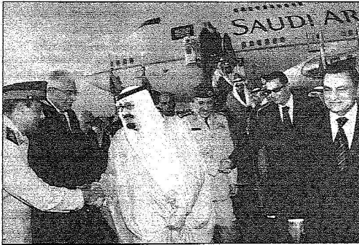
.. ويمصافح كبار المسؤولين المصريين