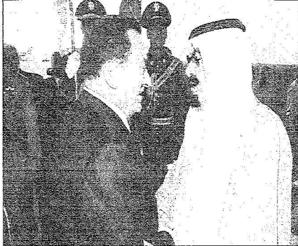
الملك يصافح الرئيس مبارك لدى وصوله مطار القاهرة