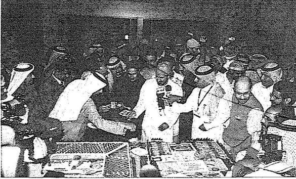
«تورثة» نجاح العملية بعد فصل التوامتين