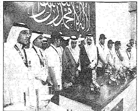
الأمير فيصل بن خالد أثناء تكريم معرض المكتبات العلمية