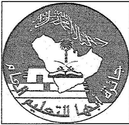
شعار جائزة أبها للتعليم العام

وأكد أن الجائزة تسعى إلى تحقيق وتنمية الانتماء الوطني والاعتزاز بمقدراته ومكتسباته وتأتي في إطار حرص سمو أمير المنطقة على تشجيع ودعم كل المبدعين والمتميزين من أبناء منطقة عسير في كافة ميادين التربية والتعليم وأشار إلى ان جائزة ابها