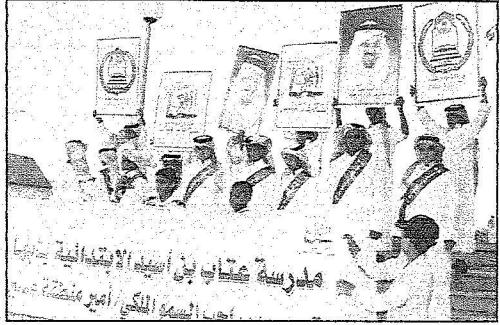
طلاب مدارس عسير في استقبال سموه