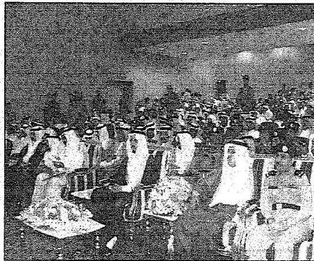
ويشرف حفل جائزة أيتها للتعليم العام