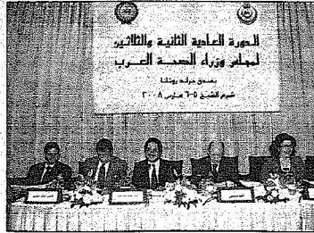
وزير الصحة خلال مؤتمر وزراء الصحة العرب

الخليج حول داء السكر. وتوصل الاجتماع إلى الدعم المادي والفني اللازم لإنشاء مركز إيواسي نموذجي لعلاج دممي المخدرات في كل من أبو ديس وغزة وتقديم التدريب للكوادر الفنية المتخصصة في علاج الإدمان. وأكد معالي وزراء الصحة العرب على أهمية تطوير عمل المجلس العربي للأختصاصات الطبية باعتباره أهم أولويات مجلس الصحة العرب في دورته الحالية. وطلب من الأمين العام للمجلس العربي للأختصاصات الطبية تقديم تقريرين متكاملين حول عملية التطوير إلى المكتب التنفيذي للمجلس في دورته المقبلة.