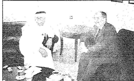
السفير البولندي يتحدث لـ«الرياض»

وعن امكانية توقيع اتفاقيات اقتصادية خلال زيارة خادم الحرمين الشريفين إلى وارسو قال السفير السعودي لدى بولندا: بالتأكيد سيتم توقيع مثل هذه الاتفاقيات أثناء الزيارة الكريمة بل وان مثل هذه الاتفاقيات تأتي على رأس قائمة ملفات الزيارة فهناك اتفاقيات اقتصادية في قائمة انتظار التوقيع من بيننا اتفاقية تشجيع وحماية الاستثمارات المتفترية بين البلدين وثقافة التعاون التجاري والاقتصادي.