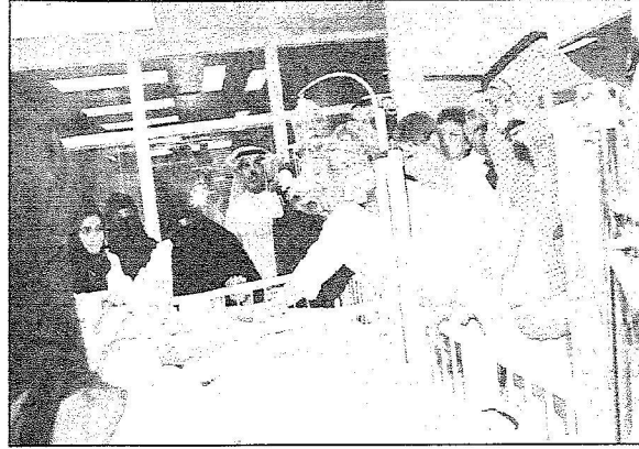
خادم الحرمين خلال زيارته للمؤتمريين البولنديين

السياير البريك لـ «الرياض»: توقيع اتفاقيات لتشجيع وحماية الاستثمار ودعم التعاون التجاري