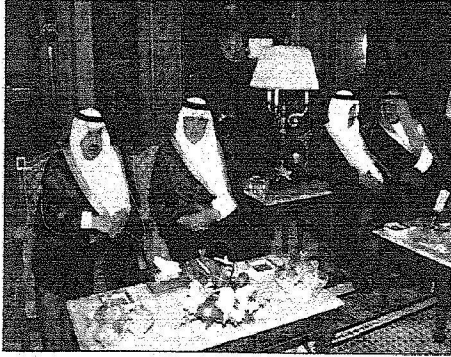
اصحاب السمو الملكي خلال الاجتماع