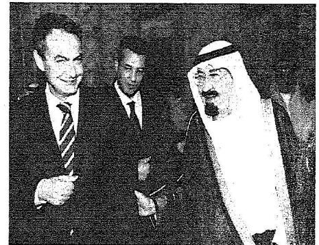
استقبال خادم الحرمين لرئيس الوزراء الاسياني