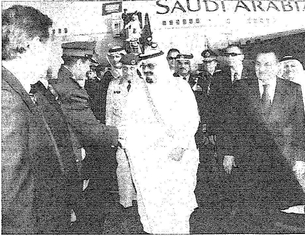
خادم الحرمين الشريفين لدى وصوله مطار عزم الشيخ، ويبدو في استقباله الرئيس المصري محمد حسني مبارك.