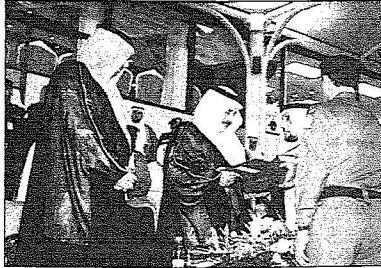
« الجزيرة » - حمود الوادي - تصوير - سعد العنزي

رعى صاحب السمو الملكي الأمير نايف بن عبدالعزيز وزير الداخلية مساء أمس الأول حفل تخرّيج الدورة التأهيلية السادسة والثلاثين للجامعيين ودورة الدبلوم الأمنية الخامسة بكلية الملك فهد الأمنية بالرياض.