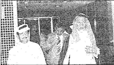
مع معالي الشيخ جيلان بن تميمي رحمه الله في قلندي لرياضي بالحرس الوطني عام 1386هـ

عاش مع المدرسة أجمل أيامها.. وأحلك ظروفها