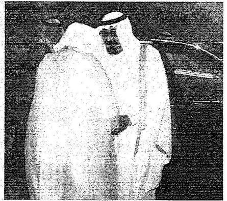
الملك لدى وصوله منى