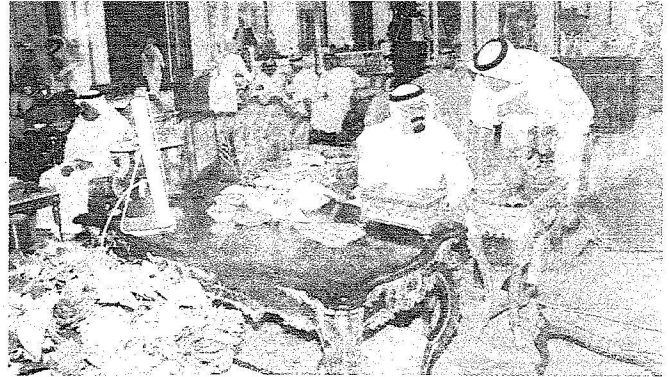
الملك عبد الله لدى وصوله قصر منى