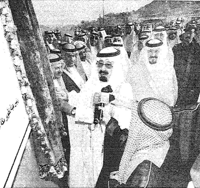
الملك يفتتح المرحلة الأولى من مشروع الجسر ويجواره الأمير سلطان

الأمير متعب بن عبد ال المالك يفتتح المرحلة الأولى من المشروع