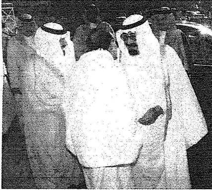
سمووزير الشؤون البلدية يتشرف بالسلام على الملك