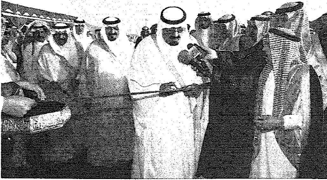
خادم الحرمين يقص الشريط إيدانا بافتتاح المشروع