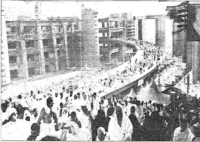
« واس »