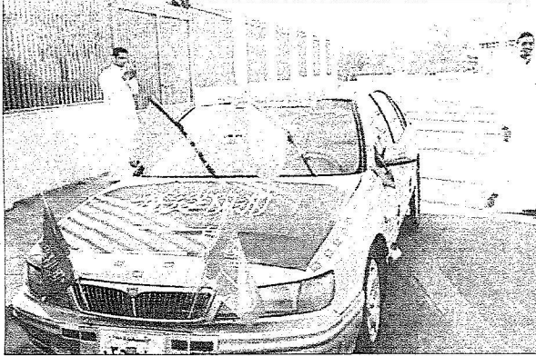
وريات التوحيد في مقدمة إحدى السيارات

الاسبوعية لمجلس الوزراء في مدينة عرعر. وذلك في اول جلسة للمجلس بعد التشكيل الوزاري الجديد تعقد خارج الرياض. هذا وقد أنهت أمانة المنطقة ولجنة الامالي استعداداتها لهذه الزيارة الكريمة وليست مدينة عرعر حلة زاهية الجمال من خلال عقود الانارة ولافتات الترحيب التي انتشرت في الشوارع والميادين العامة. فيما بدل العديد من المواطنين الوان سياراتهم الى الاخضر والابيض وارتفعت صور الملوك وولي العهد على واجهات المنازل.