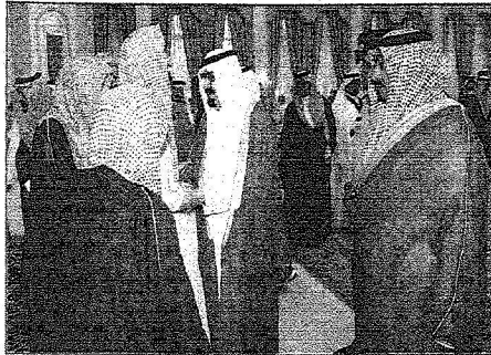
خادم الحرمين الشريفين خلال استقباله العلماء

واس (الرياض) استقبل خادم الحرمين الشريفين الملك عبدالله بن عبدالعزيز آل سعود حفظه الله في قصره بمحافظة الطائف، أمس سماحة مفتي عام المملكة ورئيس هيئة كبار العلماء وإدارة البحوث العلمية والإفتاء الشيخ عبدالعزيز بن عبدالله آل الشيخ ومفضيلة رئيس مجلس القضاء الأعلى الشيخ صالح بن محمد المحيدان وأصحاب القضية العلماء والمشايخ الذين قدموا للسلام عليه - رعاه الله- وتمنته بعلامة الوصول إلى الطائف.