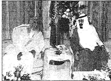
الملك يتحدث آل الشيخ