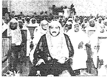
وزير الشؤون الاسلامية يتصدر المشاركين في الندوة