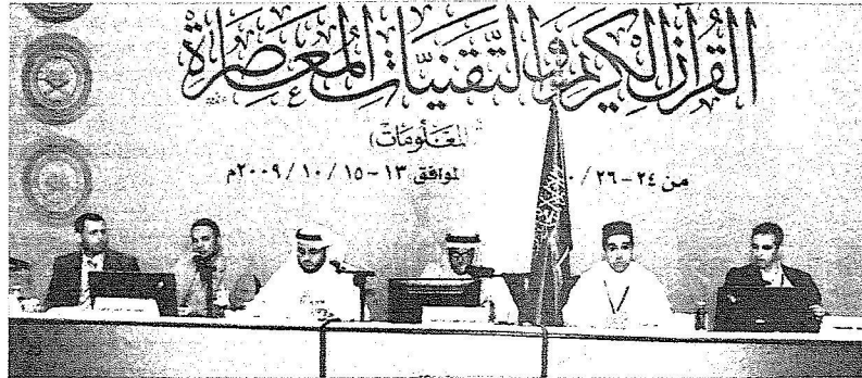
الجلسة الختامية لندوة القرآن الكريم