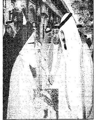
...ويستقبل الشيخ الحسين في حوار المصالحة العراقية

استقبال الحسين والهاشمي ورئيس مالي الأنسب وأعضاء رئاسة "الحوار الوطني" وأئمة المسجد الحرام