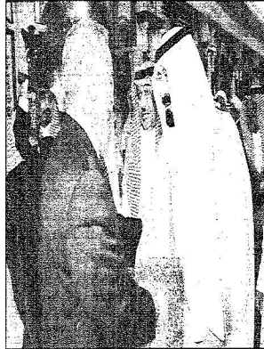
الملك عبدالله بن عبدالعزيز يلتقي نائب الرئيس العراقي