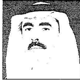
محمد حماد البلوي

قادر على القيام بكل ما يستند إليه ولقد شعرنا بفجرة كبيرة بقرار تعيينه ثانيًا نائبًا لرئيس مجلس الوزراء، وتقدم أطيب التبريات بهذه المناسبة، وهذه الثقة الغالية من حكومة خادم الحرمين الشريفين كما ندعو له بدوام التوفيق والسداد.