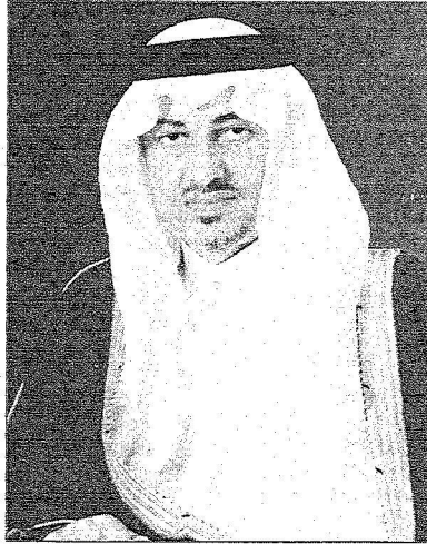
الأمير خالد الفيصل

العالمي للتعريف بنبي الرحمة محمد صلى الله عليه وسلم يهدف من هذه الأنشطة إلى التأسيس لمشاريع البداء والمبادرة وليس مجرد الدفاع ورد الجوانب بالإضافة إلى إبراز جوانب الرحمة والسماحة والخلق الكريم في شخصية النبي محمد صلى الله عليه وسلم وتزويد وسائل الإعلام العالمية بمادة علمية منسرة باللغات المختلفة لمواجهة حملات التشكيك والتشويه لشخصية النبي الكريم محمد صلى الله عليه وسلم.