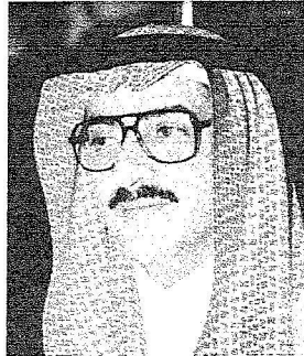
الأمير محمد بن نايف

الجمعية تهتم وتنمي كل ما يدعم المرأة ويساندها معنوياً وتاهلياً واجتماعياً على مختلف الأصعدة