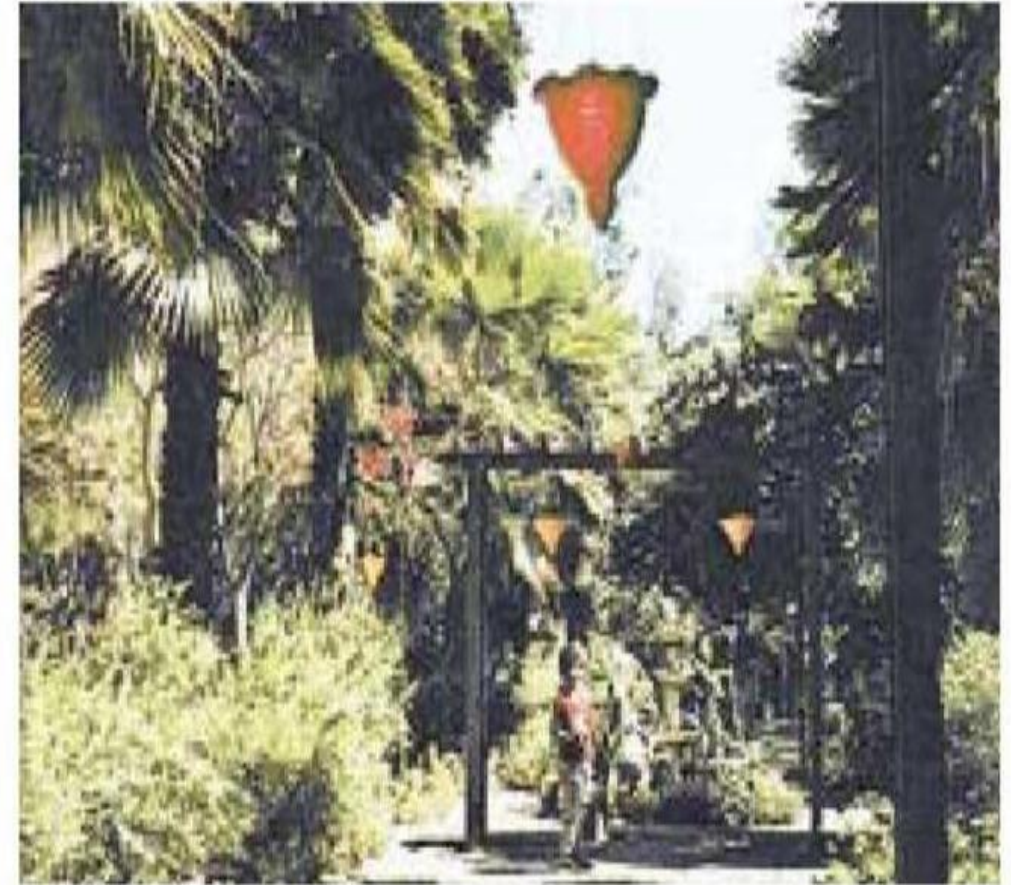
بئر عثمان ( رومة )