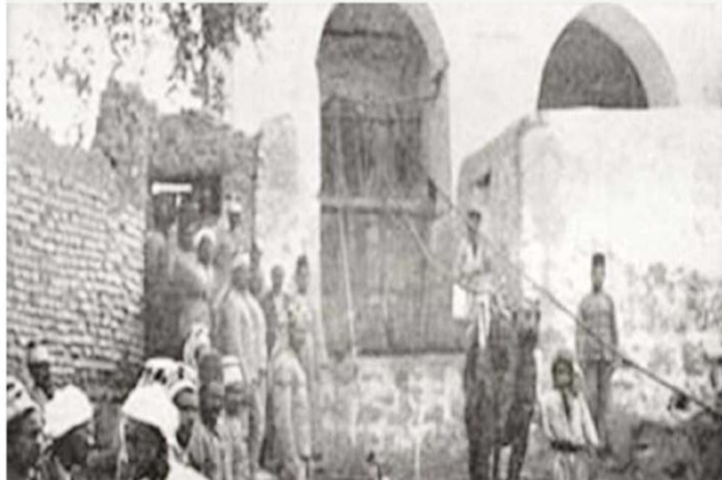
بئر أريس ( الخاتم )

عليه وسلم البسيرة، وتقع الآن بامتداد شارع قربان .