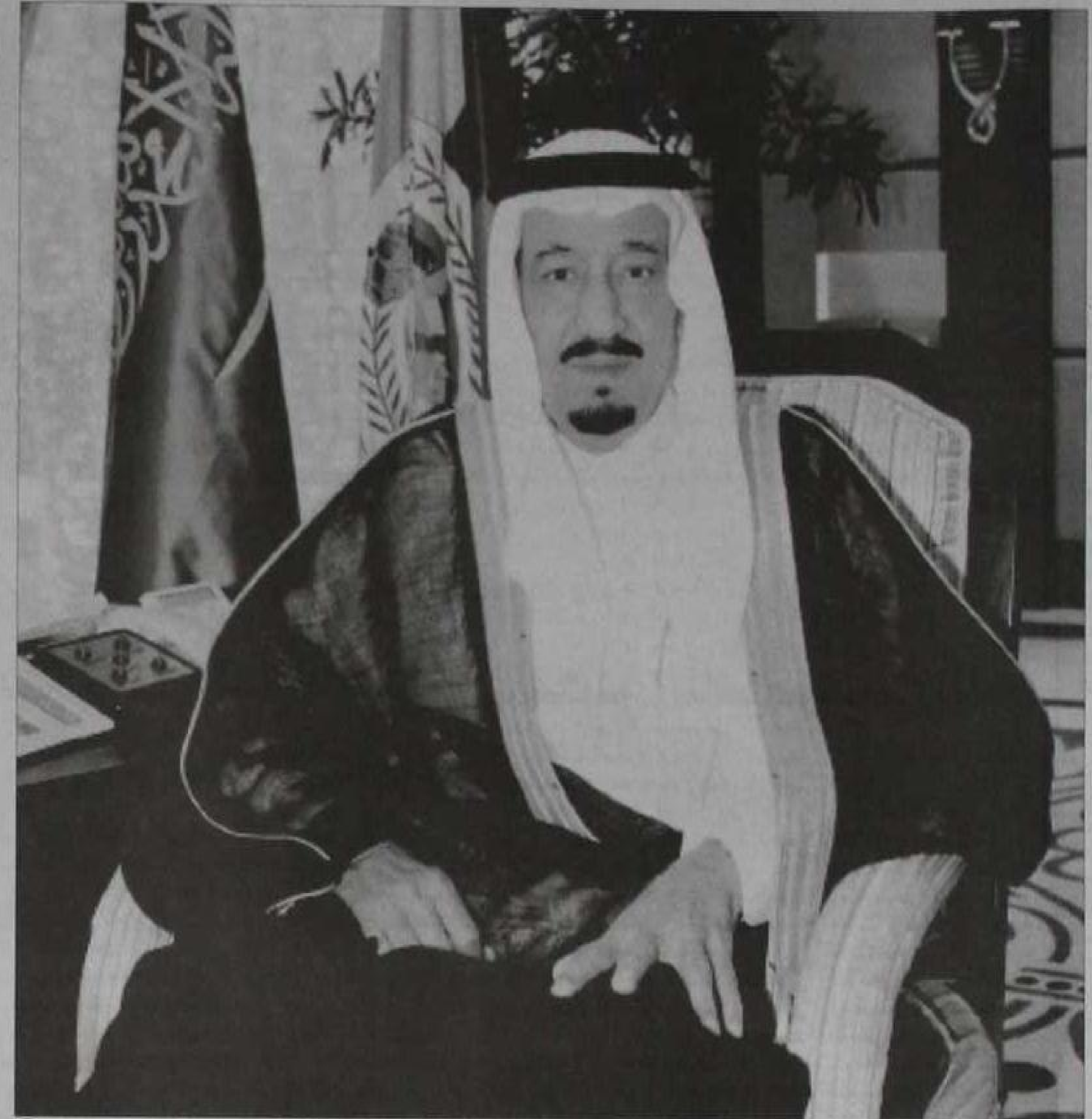
الأمير سلمان بن عبد العزيز