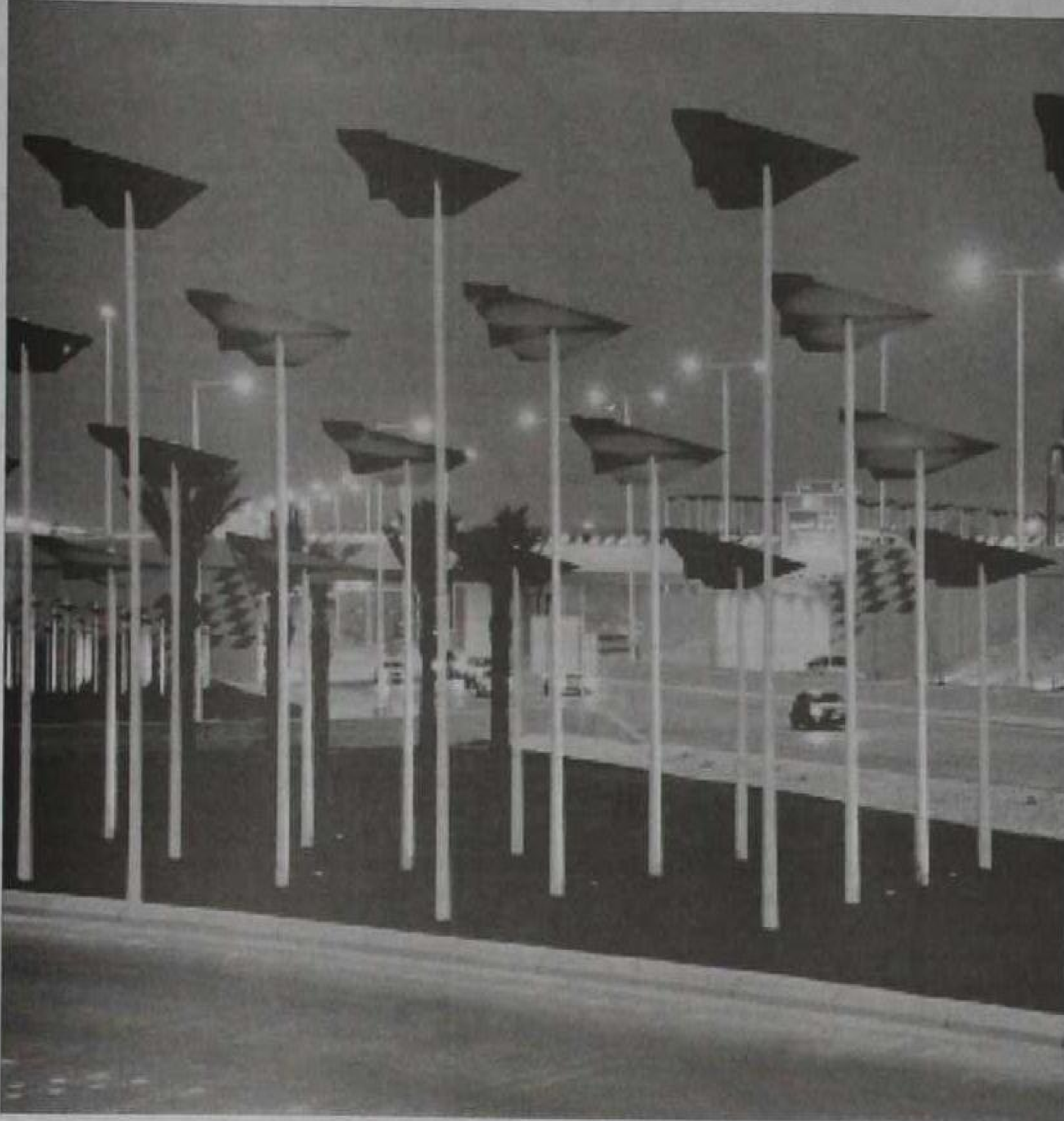
اشكال جمالية على شكل طائرات في الميناء