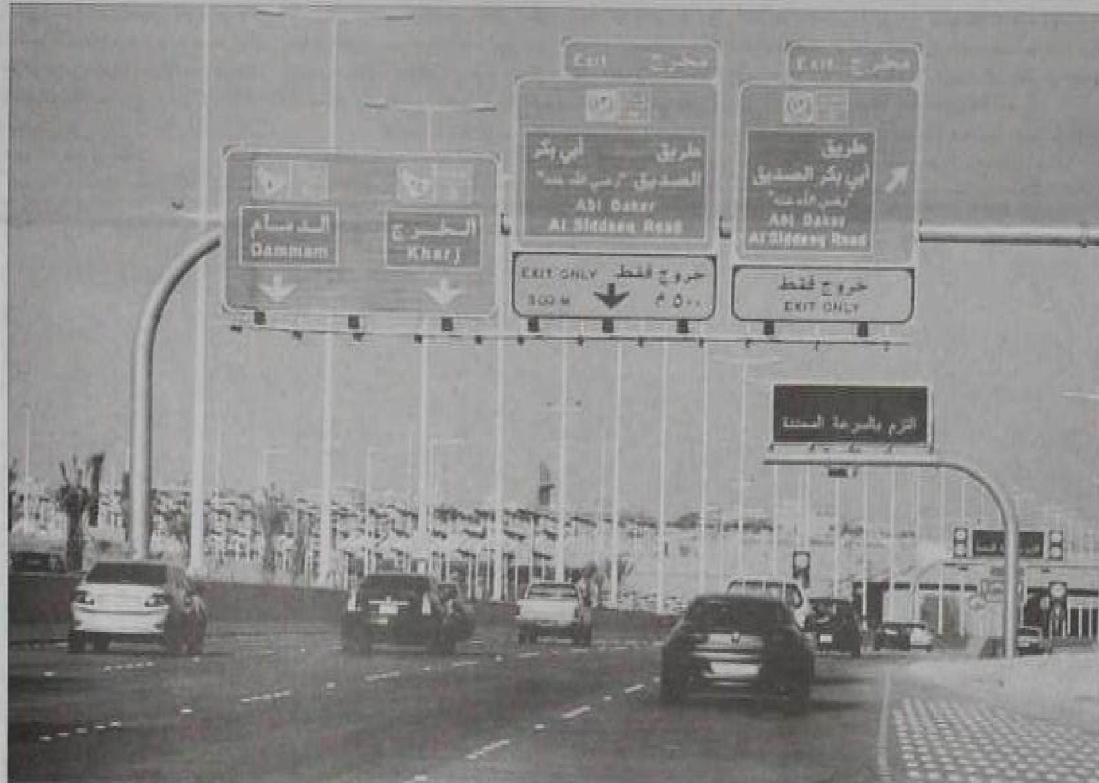
تطبيق نظم الإدارة المرورية المتقدمة في الطريق

التاريخ: 2013-03-12 رقم العدد: 12523 رقم الصفحة: 7 مسلسل: 23 رقم القصة: 2