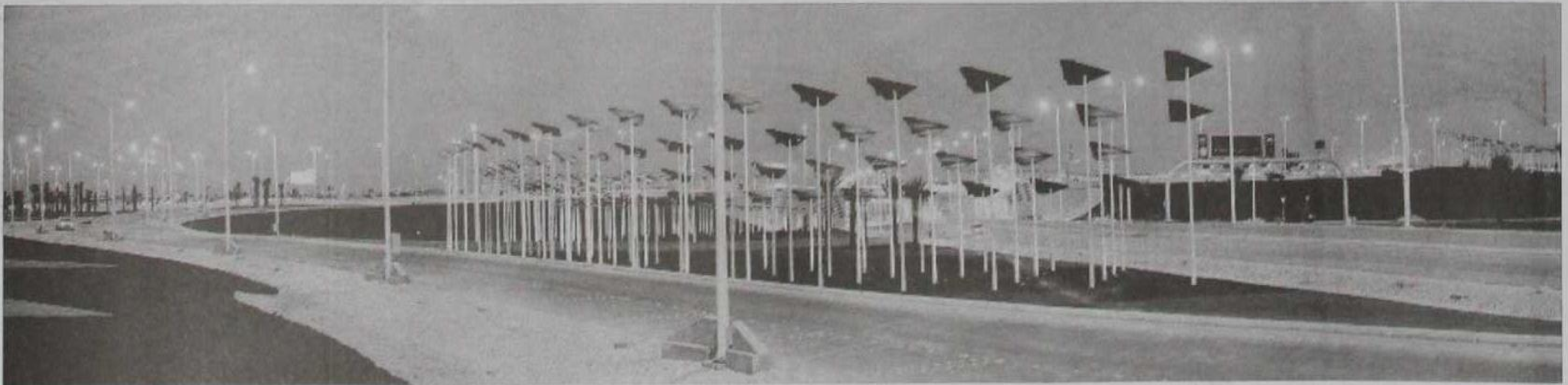
تقاطع طريق الملك عبد العزيز مع العروبة