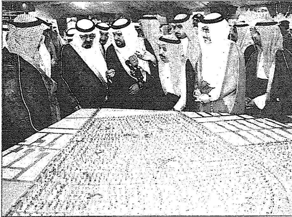
..ويطلع على مجسم لآحد المشاريع الجديدة

ناصر قمقوم. وايس (عربي) تصوير: حمد المالكي. عبد العزيز الضلعان