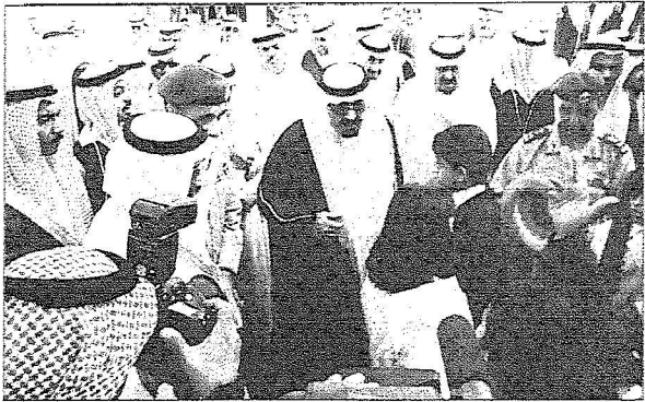
الاب القائد يصفي باهتمام الى طفل وطفلة من أبناء المنطقة