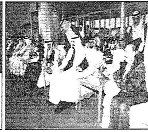
خادم الحرمين وسمو ولي العهد الأمير سلطان وسمو ولي عهد البحرين ونائب رئيس الوزراء اليمني يتكلمون سباق الهجن.