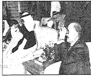
خادم الحرمين ونائب رئيس الوزراء بالجمهورية اليمنية يتكلمان بالقراب الهنجن خلال السباق