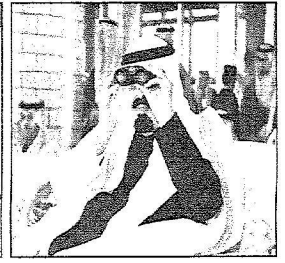
خادم الحرمين يتكلم سباق الهجن في انطلاقته للمهرجان عمر نعنس بالجنادرية

برعاية الملك عبدالله وبحضور سمو ولي العهد ..